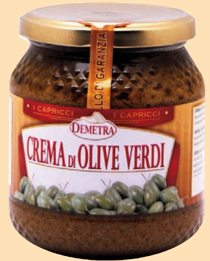
cod. 2811 Crema di Olive Verdi "Demetra" vaso vetro gr. 580 x 1