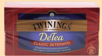
The Twinings Filtri cod. 2747 Deteinato conf. 25 bustine