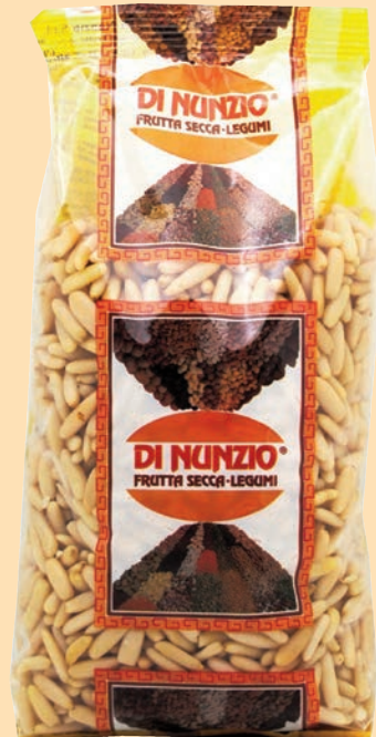
cod. 2998 Pinoli 1° scelta gr. 500