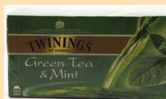
The Twinings Filtri cod. 2706 Tea Verde e Menta cod. 2644 Tea Verde e Gelsomino conf. 25 bustine