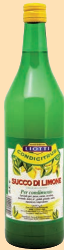
cod. 2002 Succo di Limone 100% "Liotti" 1 lt. x 1