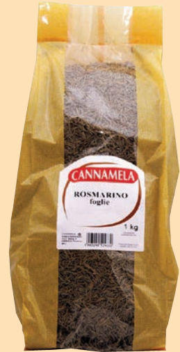
cod. 2639 Rosmarino in foglie busta Kg. 1 x 1