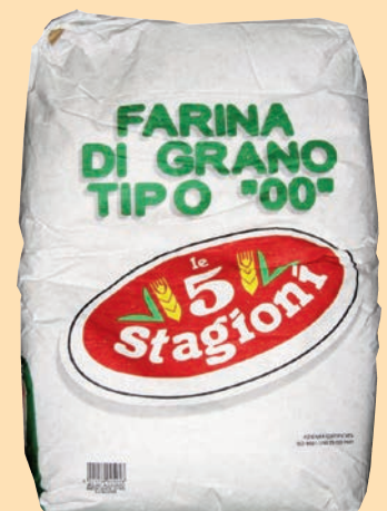
cod. 2778 Farina Doppio Zero Rinforzata VERDE Kg. 25