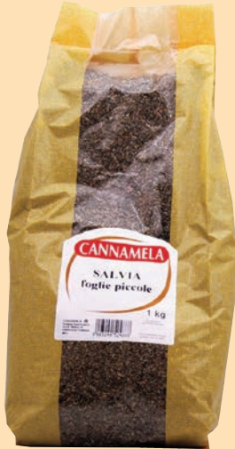
cod. 2656 Salvia in foglie piccole busta Kg. 1 x 1