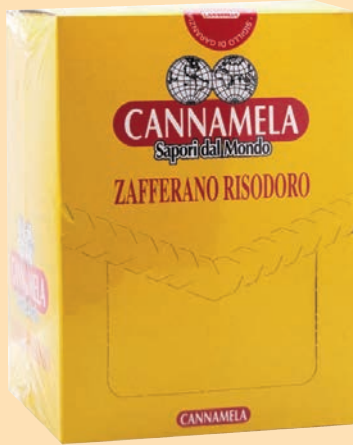
cod. 2626 Zafferano macinato buste gr. 0,30 x 50