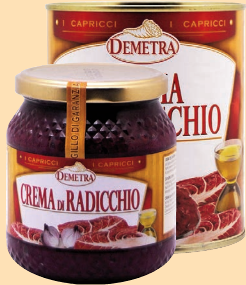
Crema di Radicchio "Demetra"

cod. 2821 - gr. 580 x 1 vaso vetro cod. 2769 - gr. 800 x 1 latta