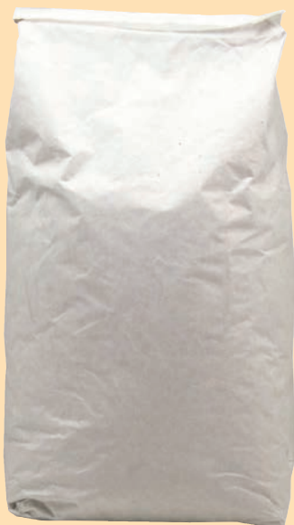
cod. 2777 Pane grattugiato "Oro" Kg. 10