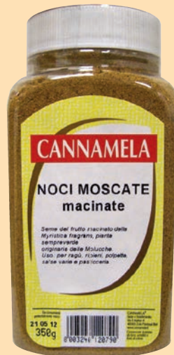
cod. 2972 Noci Moscate macinate vaso gr. 350 x 1