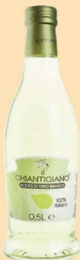
cod. 2886 Aceto bianco paglierino "Chiantigiano" 0,50 Lt x 12