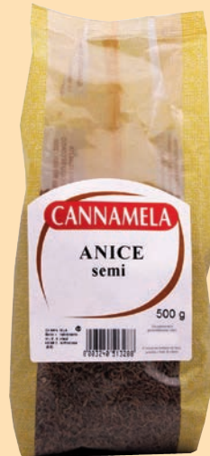
cod. 2637 Anice semi busta gr. 500 x 1