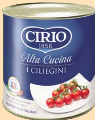
cod. 2952 Pomodorini Ciliegini Alta Cucina "Cirio" Kg. 1 x 6