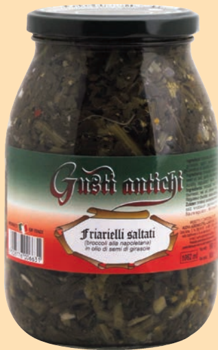
cod. 2764 Friarielli (Broccoletti) in olio di semi di girasole Kg. 1 x 1