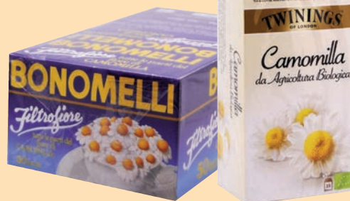
Camomilla cod. 2610 Filtro Fiore Bonomelli conf. 50 bustine