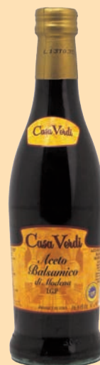
cod. 2881 Aceto Balsamico I.G.P. "Casa Verdi" 0,50 lt x 12