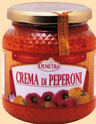
cod. 2992 Crema di Peperoni "Demetra" vaso vetro gr. 580 x 1