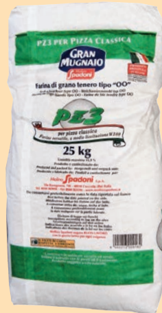
cod. 2797 Farina Doppio Zero PZ 3 per pizza classica Kg. 25