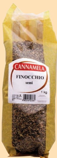
cod. 2622 Finocchio semi busta Kg. 1 x 1