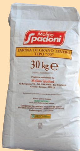
cod. 2672 Farina Doppio Zero Verde per ogni esigenza Kg. 30