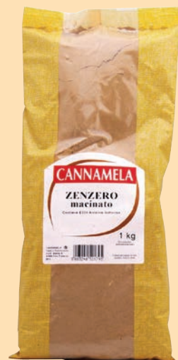
cod. 2657 Zenzero macinato busta Kg. 1 x 1