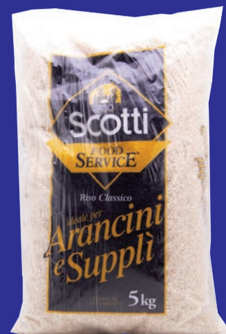
cod. 3092 Riso per Arancini & Suppli "Scotti" 10 Kg.