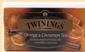
The Twinings Filtri cod. 2729 Arancia e Cannella conf. 25 bustine