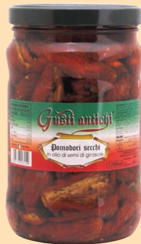
cod. 2859 Pomodori secchi a spicchi in olio di semi Kg. 1,7