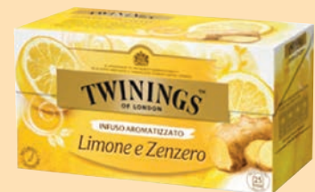
Infuso Twinings Filtri cod. 2851 Infuso Limone e Zenzero conf. 25 bustine