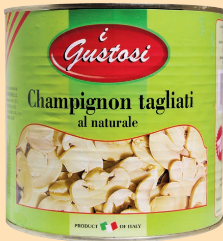
cod. 2870 Champignons a fette al naturale Kg. 2,6 x 1