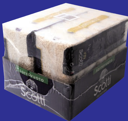
conf. 1 Kg.x10 cod. 3095 - Riso Ribe Parboiled cod. 3096 - Riso Arborio cod. 3091 - Riso Carnaroli