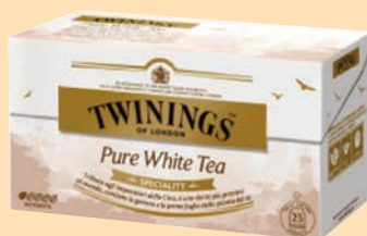
The Twinings Filtri cod. 2965 Pure White Tea conf. 25 bustine