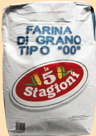
cod. 2690 Farina Doppio Zero AZZURRA Kg. 25