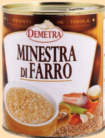
cod. 2810 Minestra di Farro "Demetra" latta gr. 800 x 1