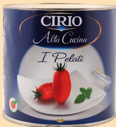
cod. 2930 Pomodori Pelati Cirio "Alta cucina" Kg. 3 x 3