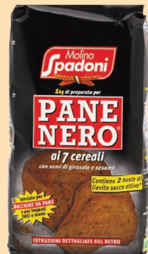
cod. 2775 Farina Pane Nero ai 7 cereali Kg. 25