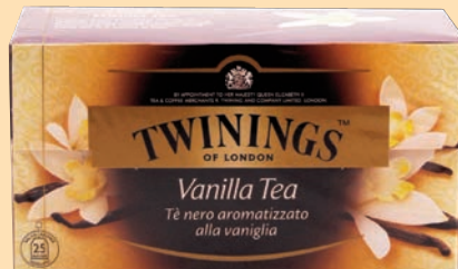
The Twinings Filtri cod. 2648 alla Vaniglia conf. 25 bustine