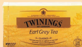
The Twinings Filtri cod. 2609 Earl Grey conf. 25 bustine