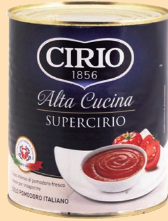
cod. 2961 Doppio Concentrato di Pomodoro "Supercirio" gr. 850 x 6