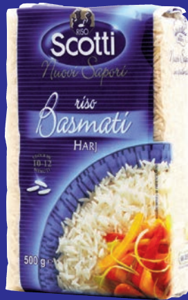
cod. 3090 Riso Basmati "Scotti" 500 gr.x12