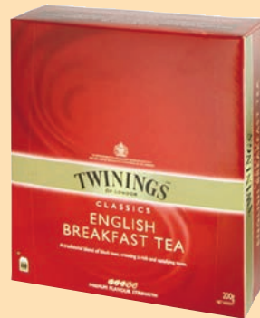
The Twinings Filtri cod. 2960 Classic English Breakfast Tea conf. 100 bustine