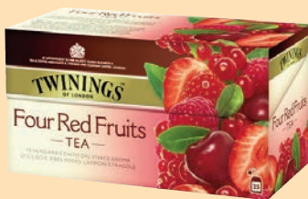
The Twinings Filtri cod. 2703 Quattro Frutti Rossi conf. 25 bustine