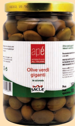
cod. 2631 Olive verdi giganti in olio extra vergine d'oliva Kg. 1,7 x 1