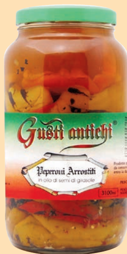
cod. 2831 Peperoni arrostiti in olio di semi di girasole Kg. 3,1 x 1