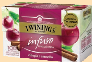
The Twinings Filtri cod. 2708 Ciliegia e cannella conf. 20 bustine