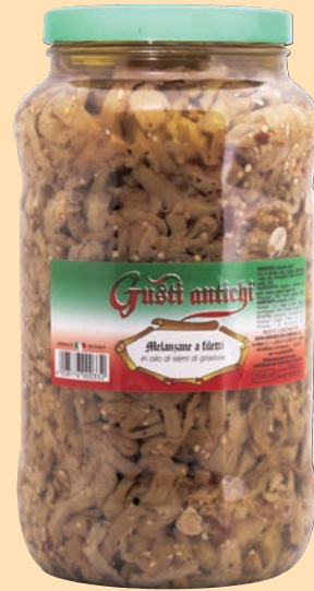
cod. 2847 Melanzane a filetti in olio Kg. 3,1