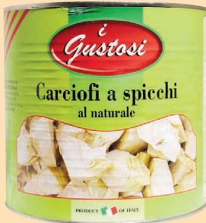
cod. 2846 Carciofi a spicchi al naturale Kg. 2,6 x 1