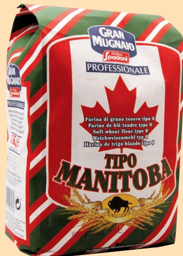
cod. 2781 Farina Manitoba PZ 8 per rinforzare farine deboli Kg. 5 x 1