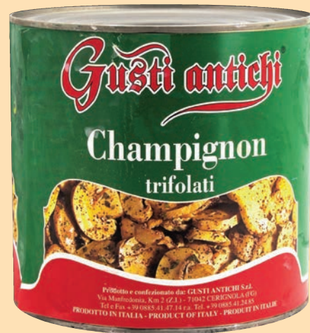
cod. 2858 Champignons trifolati in olio di semi di girasole Kg. 2,6 x 1