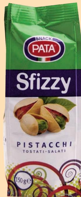
cod. 2838 Pistacchi Tostati Pata gr.150 x 08