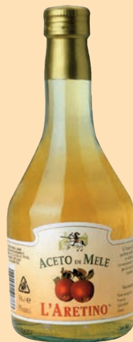
cod. 2882 Aceto di mele "L'aretino" 0,50 Lt x 12