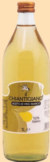
cod. 2880 Aceto bianco paglierino "Chiantigiano" 1 Lt x 12