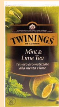
The Twinings Filtri cod. 2739 Menta e lime conf. 25 bustine