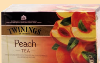
The Twinings Filtri cod. 2991 alla Pesca conf. 25 bustine