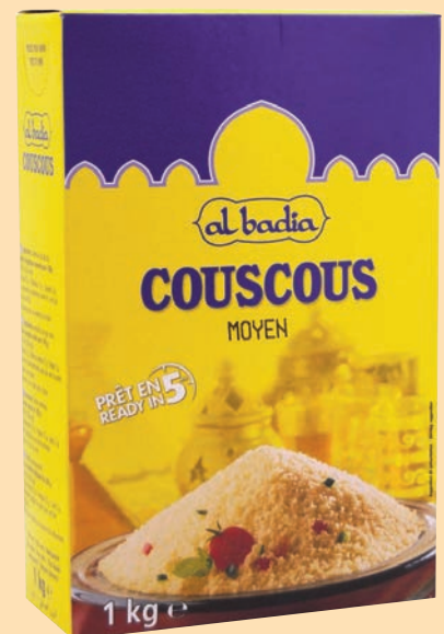
cod. 2701 Cous Cous "Sayda" 1 Kg.