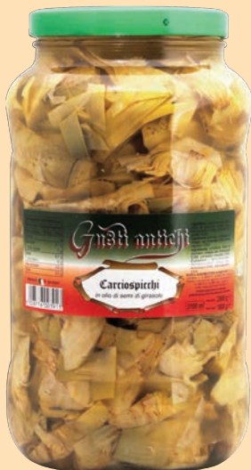
cod. 2889 Carciofi a Spicchi in olio di semi di girasole Kg. 3,1 x 1