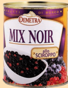
cod. 2999 Frutti di Bosco gr. 900 x 1