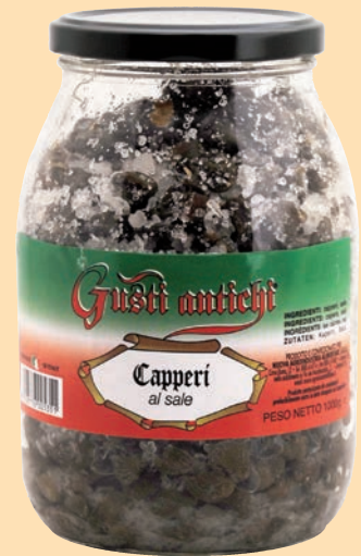
cod. 2841 Capperi al sale Kg. 1 x 1