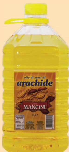
cod. 2670 Olio di semi di arachidi "Mancini" Pet 5 Lt x 2