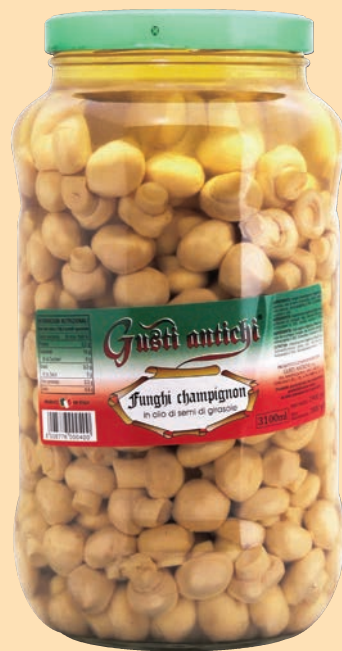
cod. 2835 Funghetti Champignon interi in olio Kg. 3,1 x 1