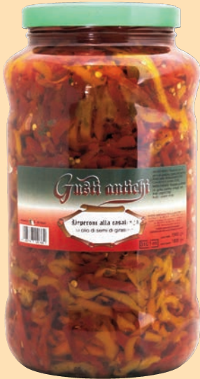
cod. 2849 Peperoni a filetti in olio Kg. 3,1