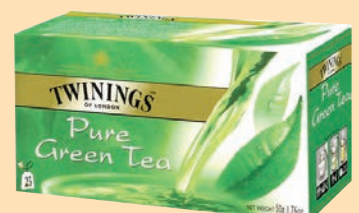
The Twinings Filtri cod. 2978 Tea Verde conf. 25 bustine