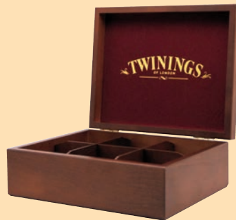
Twinings cod. 7411 Espositore x 6* *bustine vendute separatamente