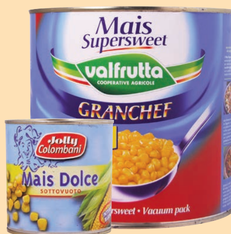
cod. 2871 Mais dolce al naturale gr. 326 x 12