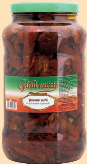
cod. 2829 Pomodori secchi a spicchi in olio di semi Kg. 3,1