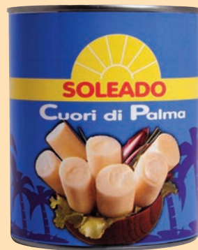
cod. 2839 Cuori di Palma al naturale gr. 800 x 1