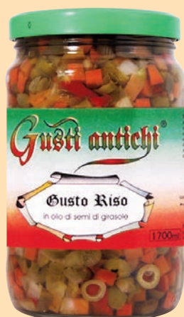
cod. 2830 Gusto Riso per insalata di riso in olio di semi di girasole Kg. 1,7 x 1