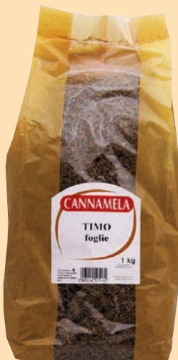
cod. 2619 Timo in foglie busta Kg. 1 x 1