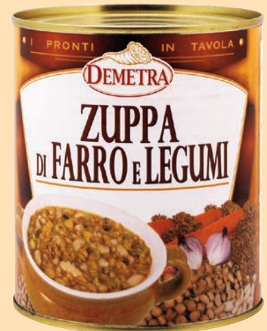
cod. 2705 Zuppa di Farro e Legumi "Demetra" latta gr. 900 x 1