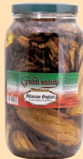
cod. 2822 Melanzane Grigliate in olio di semi di girasole Kg. 3,1 x 1