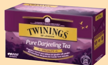
The Twinings Filtri cod. 2976 Pure Darjeeling Tea conf. 25 bustine