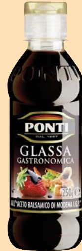
Glassa di Aceto Balsamico Top Down "Ponti" cod. 2600 - ml. 500 x 6