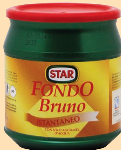
cod. 2969 Fondo Bruno "Star" granulare vaso gr. 500 x 1