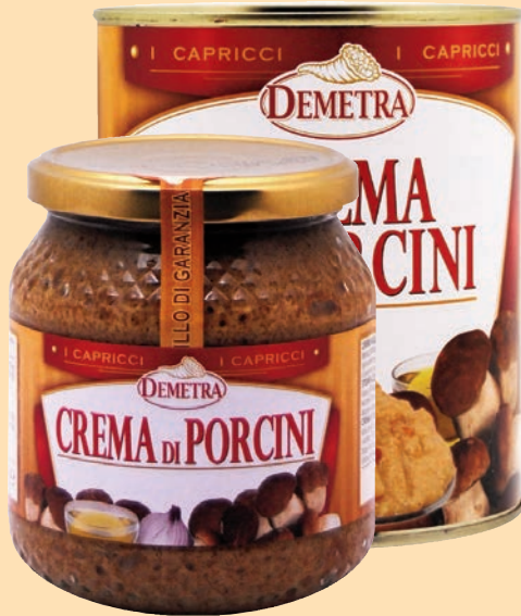
Crema di Porcini "Demetra"

cod. 2821 - gr. 580 x 1 vaso vetro cod. 2769 - gr. 800 x 1 latta