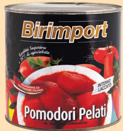
cod. 2786 Pomodori Pelati Birimport Kg. 3 x 6