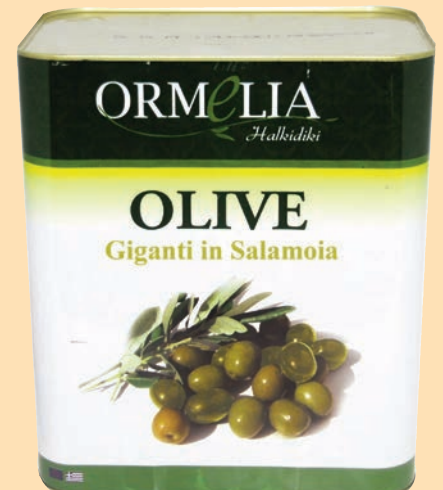
cod. 2874 Olive verdi "Super Mammouth" in salamoia Kg. 8 x 1