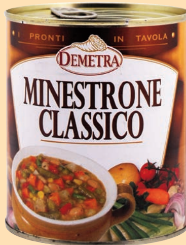
cod. 2957 Minestrone Classico "Demetra" latta gr. 840 x 1