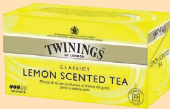
The Twinings Filtri cod. 2634 Lemon conf. 25 bustine