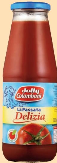
cod. 2942 Passata di Pomodoro "Jolly Colombani" gr. 700 x 12