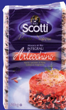
cod. 3097 Riso Arlecchino "Scotti" 500 gr.x12