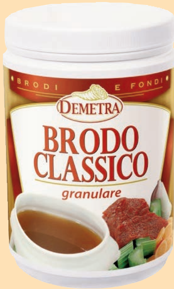
cod. 2719 Brodo Classico "Demetra" gr. 800 x 1