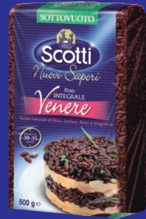
cod. 3094 Riso Gran Nero "Scotti" 1 Kg. x 10