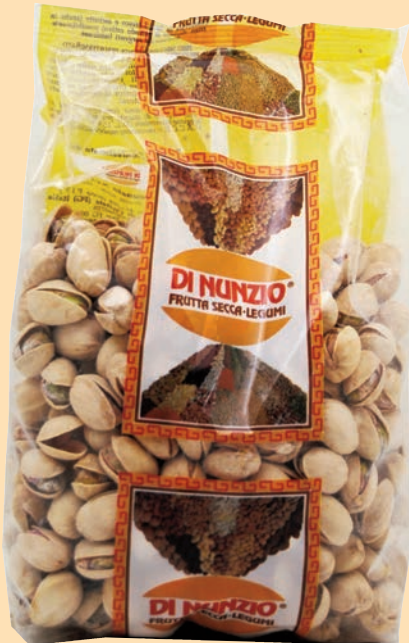
cod. 2687 Pistacchi XXL gr. 500 x 6