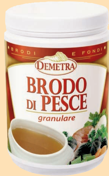
cod. 2964 Brodo di Pesce "Demetra" gr. 800 x 1