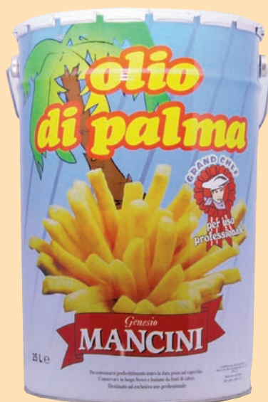
cod. 2776 Olio di Palma Fusto "Mancini" 25 Lt x 1