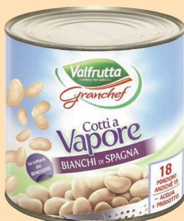
Fagioli Bianchi di Spagna Cotti al Vapore "Valfrutta" cod. 2691 - Kg. 3 x 3