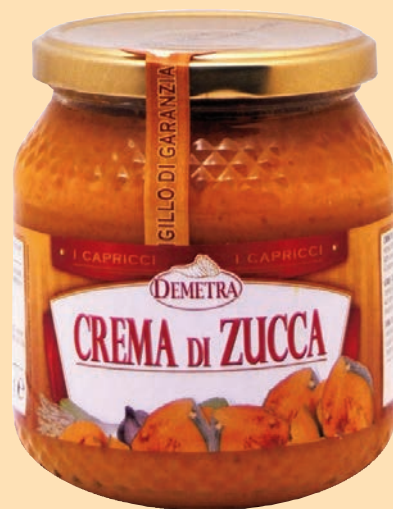
cod. 2816 Crema di Zucca "Demetra" vaso vetro gr. 580 x 1