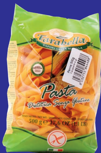
cod. 3155 Penne Rigate 448 gr. 500 x 12