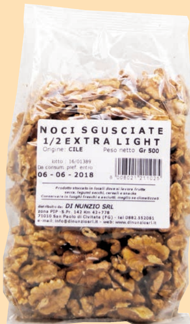
cod. 2974 Noci Sgusciate mezze gr.500