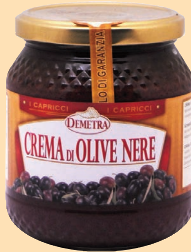
cod. 2854 Crema di Olive Nere "Demetra" vaso vetro gr. 580 x 1