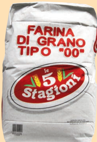
cod. 2796 Farina Doppio Zero ROSSA Kg. 25