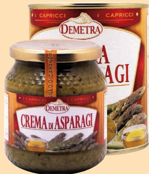
Crema di Asparagi "Demetra"

Crema di Salmone "Demetra" vaso vetro gr. 580 x 1