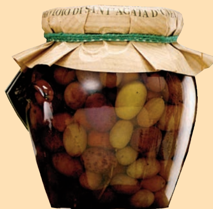
cod. 2665 Olive taggiasche snocciolate in salamoia Apè gr. 650 x 1