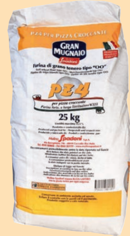
cod. 2792 Farina Doppio Zero PZ 4 per pizza croccante Kg. 25