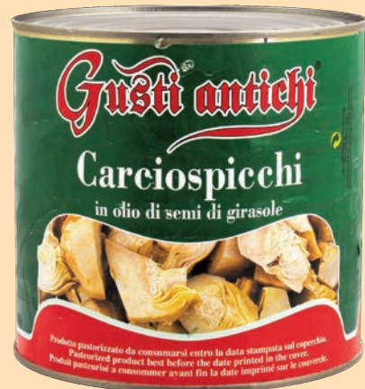
cod. 2735 Carciofi a spicchi in olio di semi di girasole Kg. 2,65 x 1