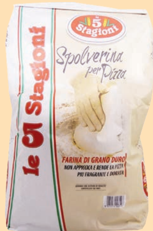
cod. 2948 Farina Doppio Zero SPOVERIZZA Kg. 10