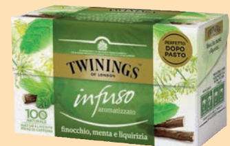
The Twinings Filtri cod. 2654 Finocchio, menta, liquirizia conf. 20 bustine