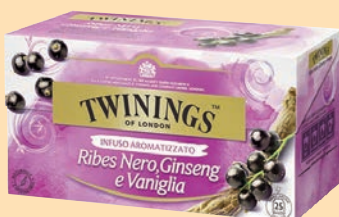
Twinings Filtri cod. 2645 Ribes nero, ginseng e vaniglia conf. 20 bustine