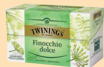
Twinings Filtri cod. 2862 Finocchio dolce conf. 20 bustine