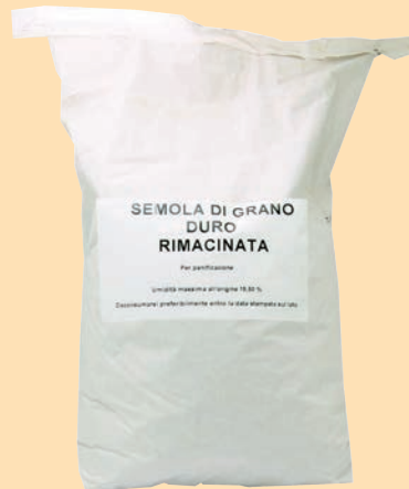
Semola Rimacinata cod. 2894 - "5 Stagioni" Kg. 10