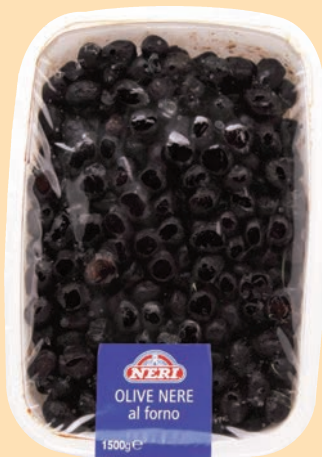
cod. 2731 Olive nere al forno Kg. 1,5 x 2