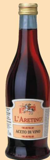
cod. 2885 Aceto di Rosso "L'aretino" 0,50 Lt x 12