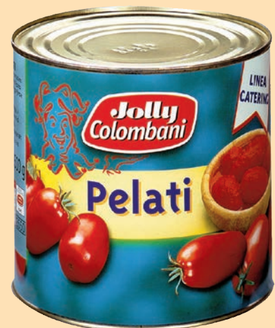
Pomodori Pelati "Jolly Colombani" cod. 2906 - Kg. 3 x 6