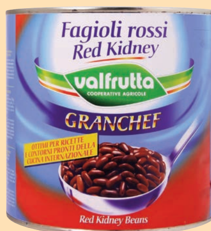
Fagioli Red Kidney "Valfrutta" cod. 2695 - Kg. 3 x 3