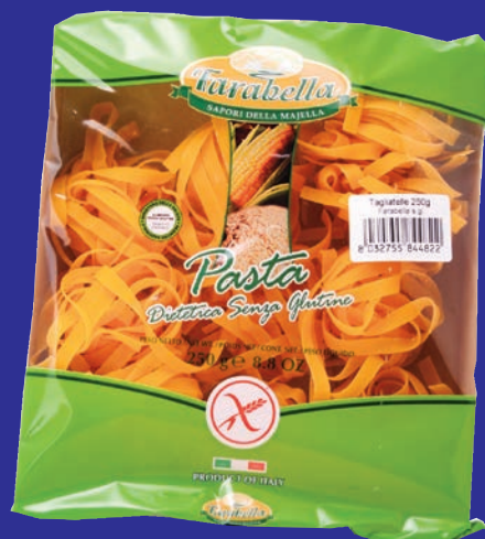
cod. 3156 Tagliatelle 482 gr. 250 x 6