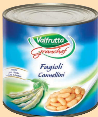
Fagioli Cannellini lessati "Valfrutta" cod. 2674 - Kg. 3 x 3 cod. 2949 - gr. 800 x 6