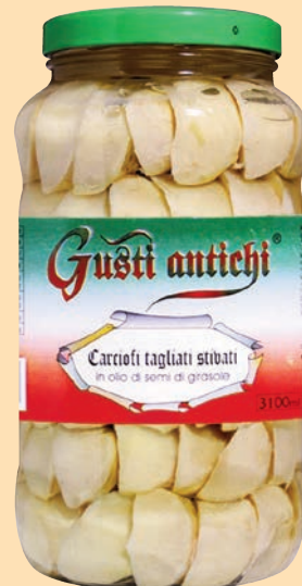
cod. 2937 Carciofi a Spicchi Stivati in olio di semi di girasole Kg. 3,1 x 1