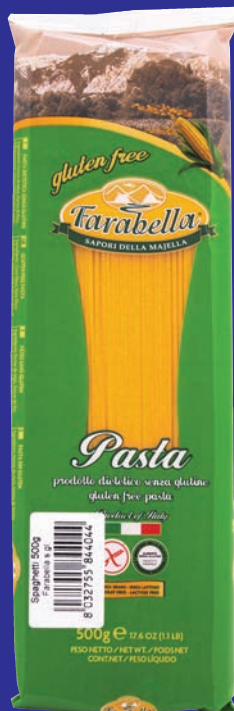
cod. 3169 Spaghetti 404 gr. 500 x 12