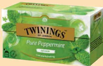
Infuso Twinings Filtri cod. 2973 Infuso Menta Piperita conf. 25 bustine