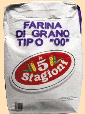
cod. 2791 Farina Doppio Zero BLU Kg. 25