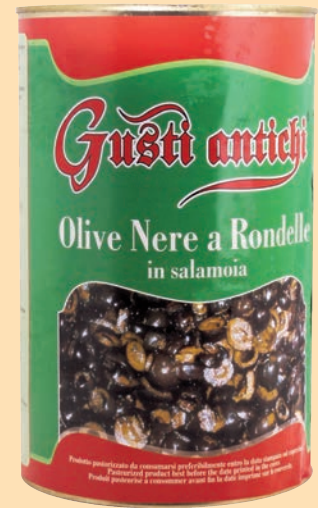
cod. 2878 Olive nere a rondelle in salamoia Kg. 3,1 x 1