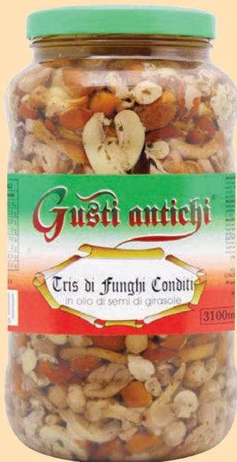
cod. 2767 Tris di Funghi in olio di semi di girasole Kg. 3,1 x 1