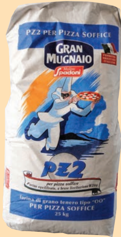
cod. 2926 Farina Doppio Zero PZ 2 per pizza soffice Kg. 25