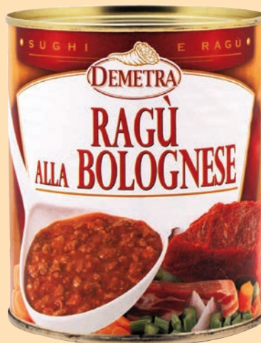
cod. 2614 Ragù Bolognese "Demetra" latta gr. 830 x 1