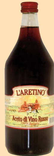
cod. 2883 Aceto di Rosso "L'aretino" 1 Lt x 12