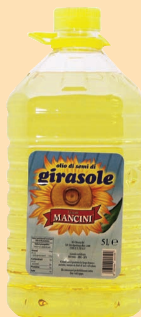
cod. 2925 Olio di semi di girasole "Mancini" Pet 5 Lt x 2