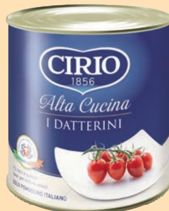
cod. 2963 Pomodorini Datterini Alta Cucina "Cirio" Kg. 1 x 6