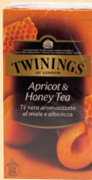
The Twinings Filtri cod. 2721 Albicocca e miele conf. 25 bustine