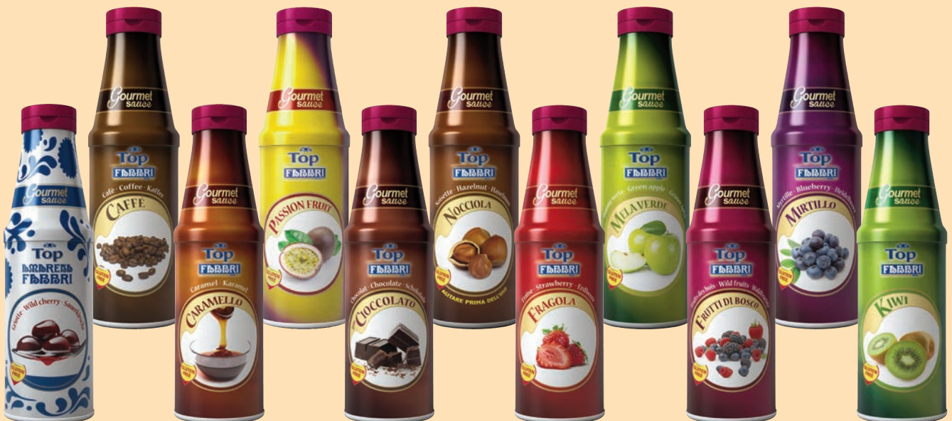
Topping Fabbri - conf. 950 gr. Senza Glutine