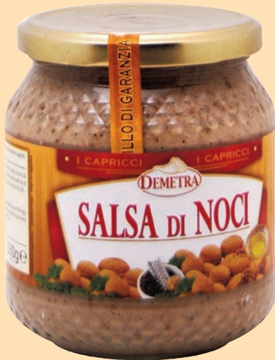
cod. 2649 Salsa di Noci "Demetra" vaso vetro ml. 580 x 1