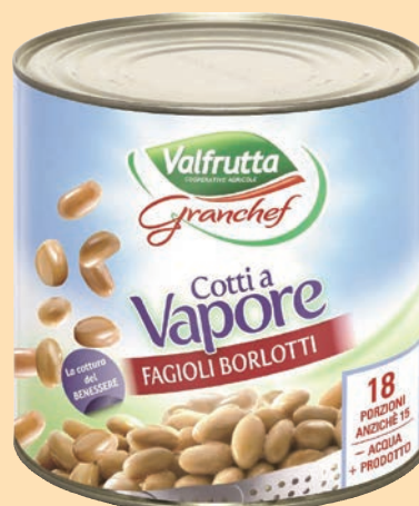
Fagioli Borlotti Cotti al Vapore "Valfrutta" cod. 2682 - Kg. 3 x 3 cod. 2941 - gr. 800 x 6 l essati