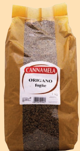
cod. 2628 Origano in foglie busta Kg. 1 x 1