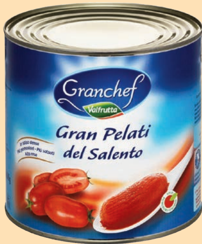
cod. 2951 Pomodori Pelati "Valfrutta" Kg. 3 x 3