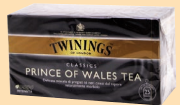
The Twinings Filtri cod. 2987 Nero Prince of Wales conf. 25 bustine