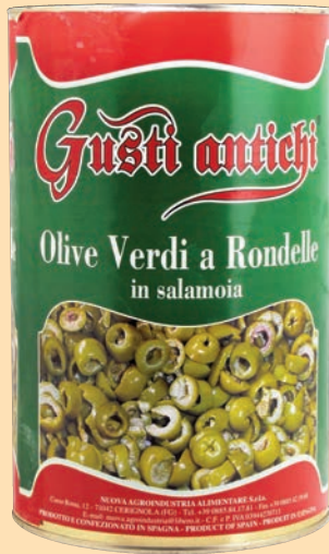
cod. 2876 Olive verdi a rondelle in salamoia Kg. 3,1 x 1